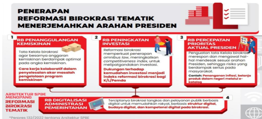
Gambar 2. Reformasi Birokrasi Tematik

dan metode reformasi birokrasi dengan melahirkan kebijakan reformasi birokrasi tematik. Kebijakan tersebut dituangkan dalam Peraturan Menteri Pendayagunaan Aparatur Negara dan Reformasi Birokrasi Nomor 3 Tahun 2023 tentang Perubahan Atas Peraturan Menteri PANRB Nomor 25 Tahun 2020 tentang Road Map Reformasi Birokrasi 2020-2024. Terdapat empat tema yang menjadi arus utama dalam penajaman reformasi birokrasi tematik yaitu penanggulangan/penghapusan kemiskinan, peningkatan investasi, digitalisasi administrasi pemerintahan, dan percepatan prioritas aktual presiden, sebagaimana terlihat dalam gambar berikut.